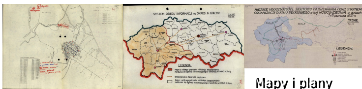
Mapy i plany dot. zabezpieczenia spotkania z