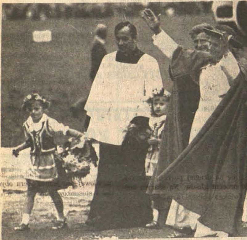
KRAKÓW. — Papież Jan Paweł II przybył do Krakowa.