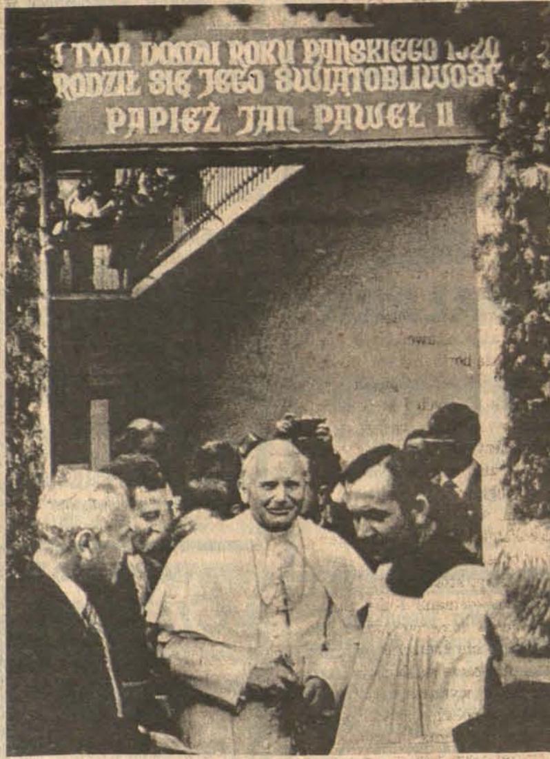
WADOWICE. — Papież Jan Paweł II wchodzi do domu, w którym urodził się w 1920 roku.