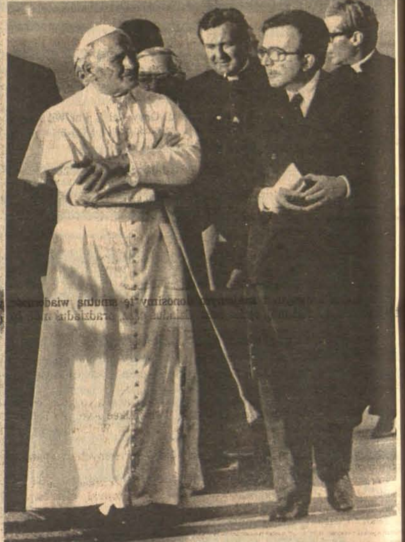
RZYM. — Papież Jan Paweł II witany przez premiera Włoch Giulio Andreottiego po powrocie z Polski.