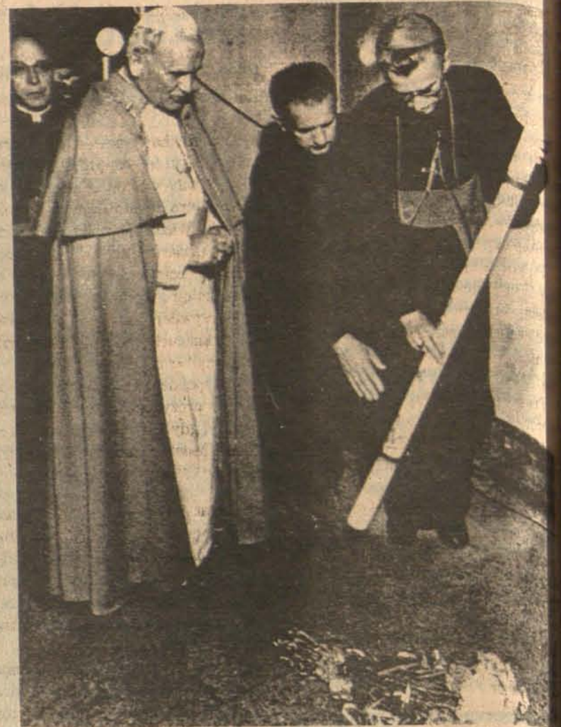
OŚWIĘCIM. — Papież Jan Paweł II złożył wieniec na grobie bł. Maksymiliana Kolbe.