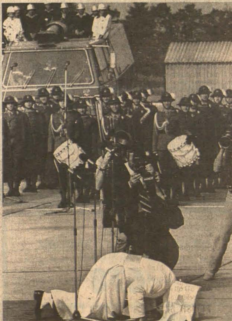
KRAKÓW. — Papież Jan Paweł II ucałował ziemię, żegnając się z Polską po zakończeniu swej 9-dniowej wizyty.