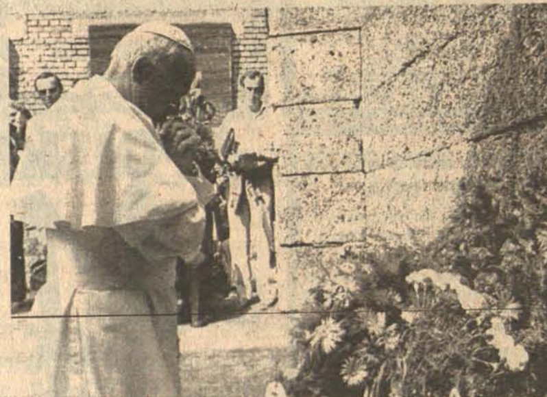
OŚWIĘCIM. — Papież Jan Paweł II odwiedził obóz zagłady Auschwitz-Birkenau.