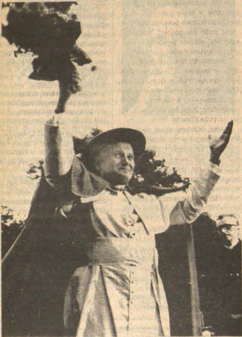
KRAKÓW. — Papież Jan Paweł II otrzymał na powitanie bukiet kwiatów.