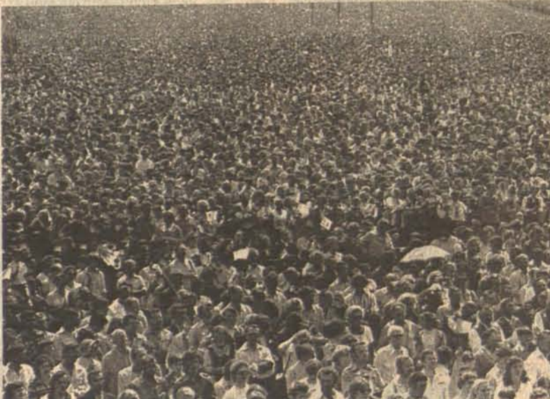
NOWY TARG. — Tysiące ludzi uczestniczyło w polowej Mszy św. odprawionej przez Papieża Jana Pawła II.